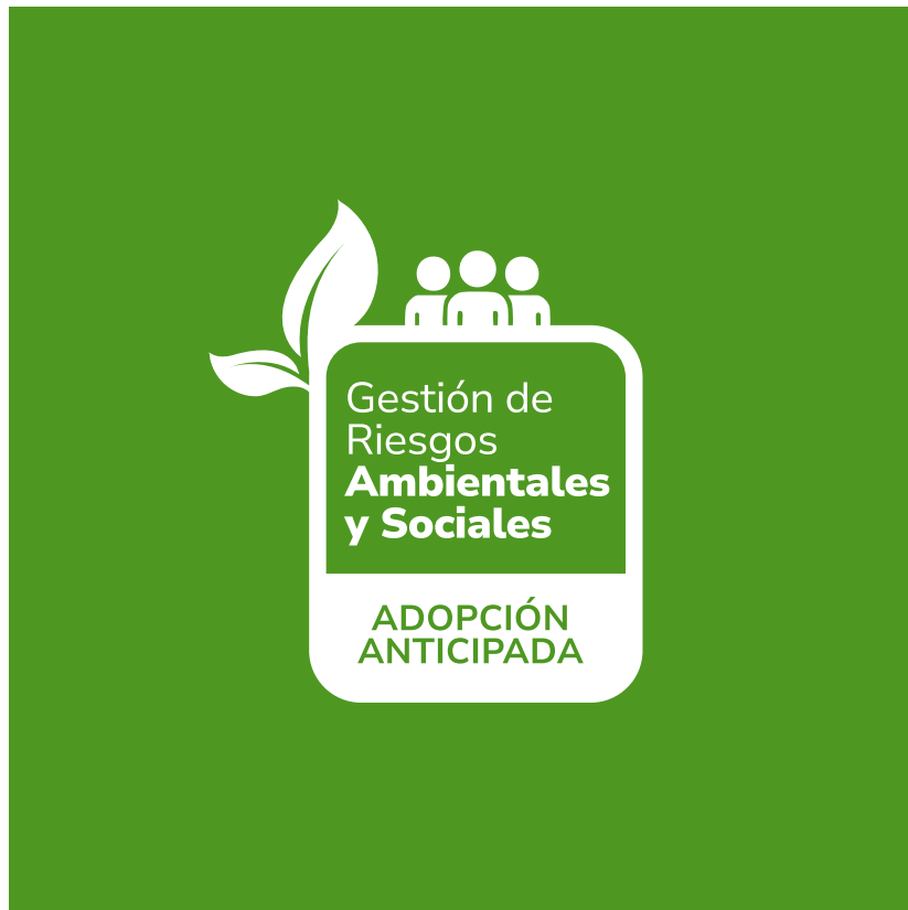
Versión en negativo